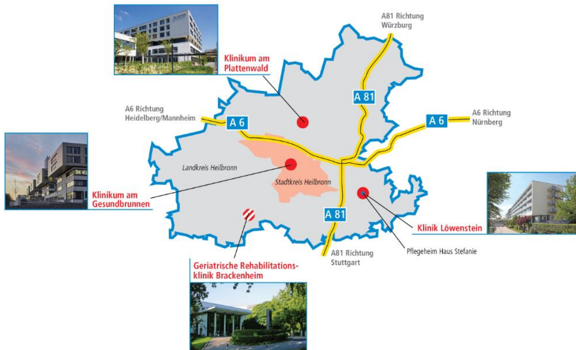
Abbildung 1: Übersicht Kliniken der SLK-Kliniken Heilbronn GmbH